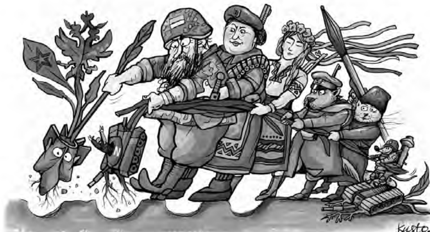
Єдність — найпотужніша зброя!