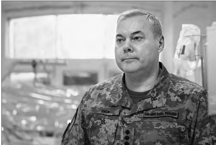
Це обладнання дає змогу для обробки операційного економіти, по-перше, час поля, по-друге, допомагає

— Унаслідок артилерійських і мінометних обстрілів, авіаційних та ракетних ударів, які ворог завдає по прикордонню, виникають питання термінового надання лікарської допомоги. Але відтепер ці лікарські бригади будуть забезпечені вже надсучасним хірургічним оснащенням, яке допоможе їм у роботі, — підкреслив генерал-лейтенант Сергій Наєв.